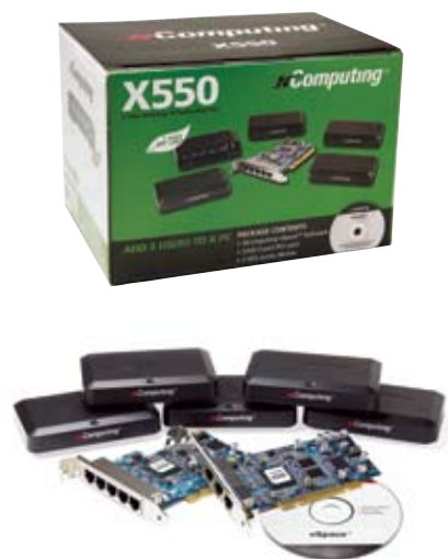
X550 & X350: placas PCI

Kits de virtualização de desktops série X